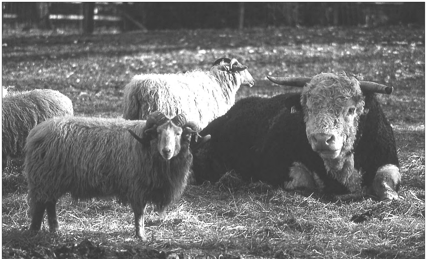
De grote jongens houden de wacht op Hoog Deelen