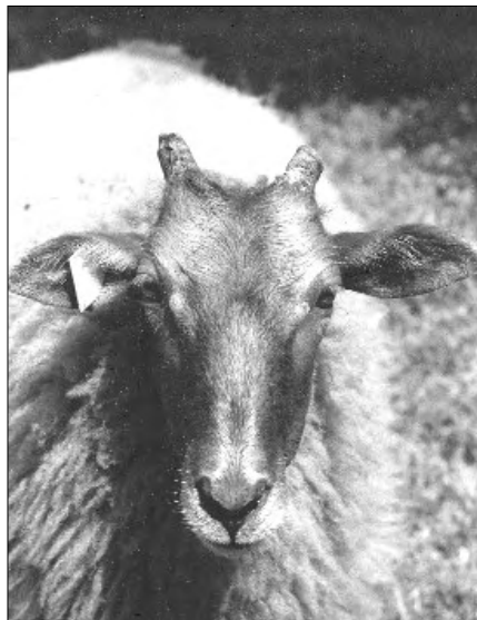
Sikje als volwassen schaap

Tranen die nog dagen zullen vloeien... waarom? Het was toch immers in het achterhuis? Nee, het is de liefde die deze tranen veroorzaakt. Of het nu achterhuis of voorhuis is! De liefde voor het leven, de liefde voor de mensen, de dieren, de planten, die het leven in al zijn vreugde en verdrieten doet Leven! De liefde die de verbinding mogelijk maakt, de ware zorg, de ware betrokkenheid, de ware passie, het ware begrip, en de ware bezieling van de ware Levensbeleving.