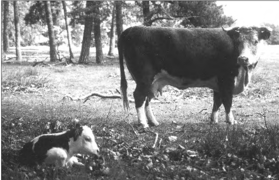
Pasgeboren kalf onder het wakend oog van de moeder

waarachtige innerlijke moraliteit en ethiek, vanuit het innerlijk weten en geweten! In veiligheid en vrijheid leven en ontwikkelen! Laten we geen slaaf worden van machthebbers die leefregels bepalen zonder dit af te stemmen op de werkelijke natuurlijke en aardse processen. STOP dit uit de hand gelopen ontkrachtende systeem. Het is genoeg geweest.